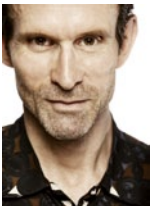
Ulrich Matthes

Wolfgang Herrndorf erhielt für sein Meisterwerk den Brentano-Preis (2011), den Deutschen Jugendliteraturpreis (2011), den Hans-Fallada-Preis (2012) und den Preis der Leipziger Buchmesse (2012).